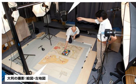
大判の撮影：絵図・古地図

大学院修了後、光学機器関連企業、情報システム企業の勤務を経て、カメラマンとして活動。文化財イメージングとしてスティル撮影、マイクロフィルム撮影、スキャンニング等に従事している。